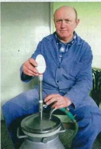
Dříve se vejce vyfukovala ústy, dnes tuto činnost zastane speciální přístroj.