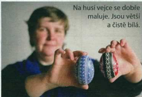
Na husí vejce se dobře maluje. Jsou větší a čistě bílá.

Procházíme obrovskou zateplenou halou i venkovním husím výběhem. „Bílá krkatá