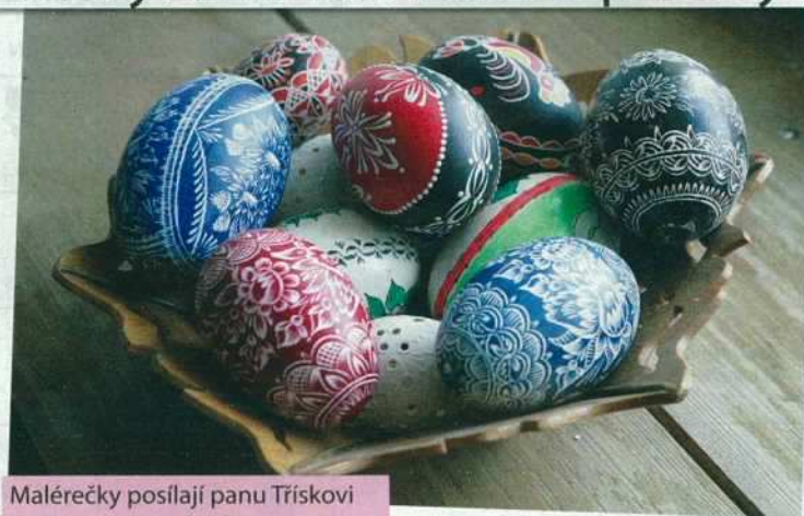
Maléřečky posílají panu Tříškoví své výtvořky na ukázkou.