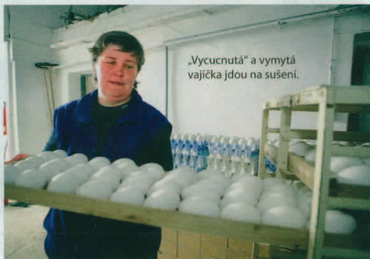
„Vycucnutá“ a vymytá vajíčka jdou na sušení.